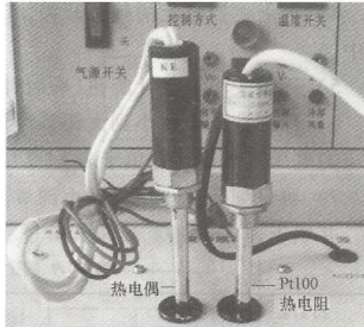
图 1 温度传感器测温安装图

1. 连接电路。 将热电偶插入加热源的一个传感器安装孔中，如图 1 所示，把其中 K 型热电偶的自由端插入主控箱面板上的热电偶 EK 插孔中作为标准传感器，与温控表一起用于控制温度，红线为正极，热电偶护套中已安置了两支热电偶，K 型（红线为正、黑线为负）和 E 型（蓝线为正、绿线为负），请注意标号。